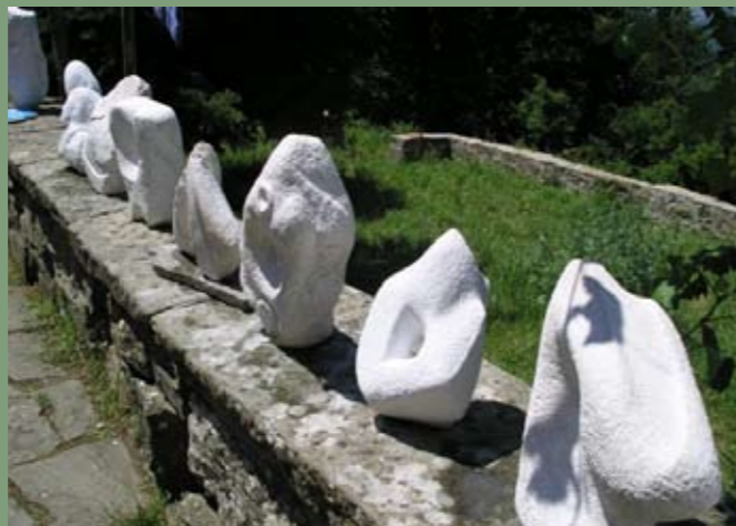
Ergebnisse aus der Praxis: Kunstoffahrt nach Florenz (jeweils in der 12. Klasse)

Vortrag/Gesprächsrunde zu den Besonderheiten der Waldorfpädagogik und den Möglichkeiten für Quereinsteiger. (Auch für Eltern, deren Kinder im Jahr 2012 eingeschult werden sollen und die die Infoveranstaltungen im Herbst/Winter nicht wahrnehmen konnten.)